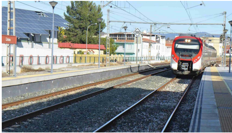
Imagen de archivo de uno de los trenes de Cercanías de Málaga.