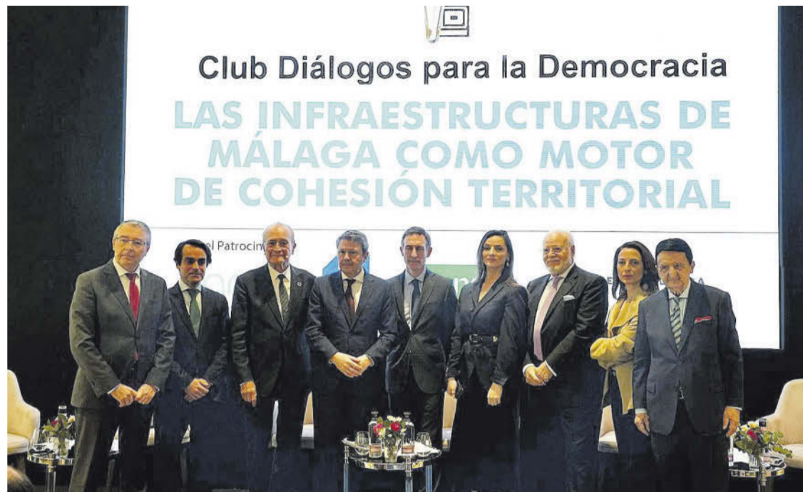
Participantes en la mesa redonda sobre las infraestructuras en la provincia de Málaga.

«Para hacer esa infraestructura estamos hablando de 3.000 millones de euros de comienzo, que acabarán en cifras mayores», continuó el secretario de Transportes, que puntualizó que la mayoría de la obra tendría que ser soterrada. «Para que eso pueda llegar a buen puerto necesita la convicción, con datos claros, de que efectivamente eso es necesario».