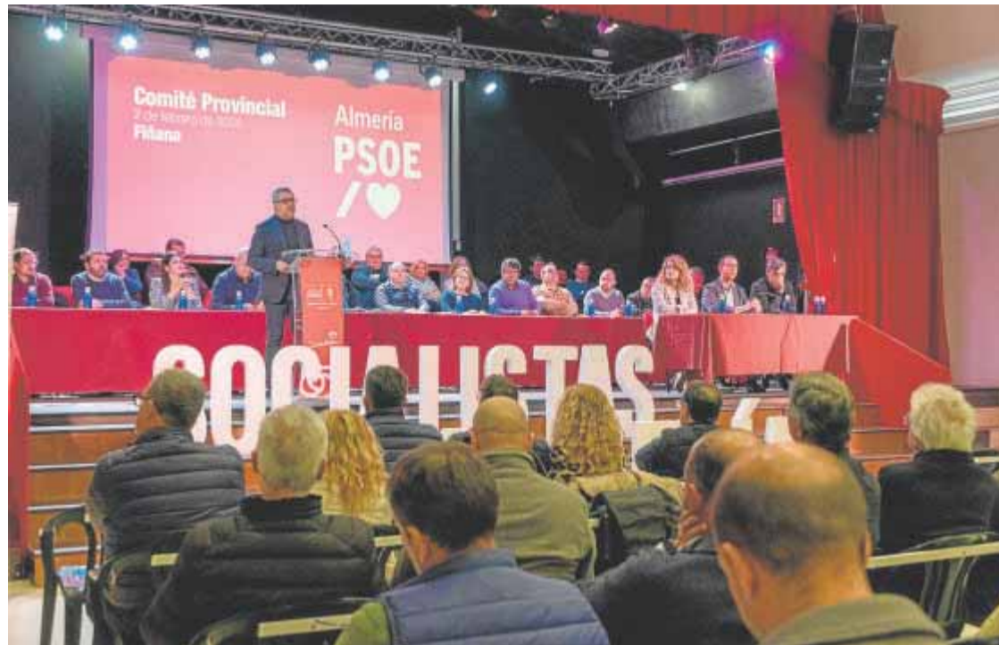
El comité provincial del PSOE de Almería se reunió ayer y aprobó el refuerzo de su estructura.

En materia ferroviaria recordó concretamente los «más de 267 millones que se destinarán a actuaciones tan significativas como la línea de alta velocidad entre Murcia y Almería, la integración en Almería en la fase 2 o la renovación de las líneas Mérida-Los Rosales y Zafra-Huelva que también tienen esta financiación».