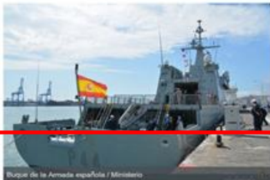
Buque de la Armada española

Desde que comenzó la crisis, uno de los ministerios más perjudicados en España ha sido el de Defensa, y eso se ha ido notando en los Presupuestos Generales del Estado (PGE). En 2013 sufrió un recorte del 5% y para 2014 es del 3,2%. Desde luego no es el más afectado. Sanidad ha sufrido mayores reducciones, pero sí pone en un serio aprieto a España dentro de la estrategia común europea, aprobada en el Consejo Europeo del pasado 19 y 20 de diciembre, y a la que deberá sumarse con fuerza para ser un país de referencia.