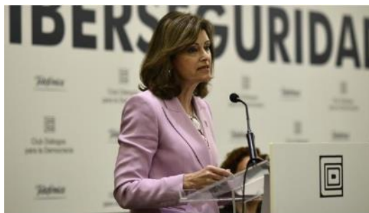
La secretaria de Estado de Seguridad, Ana Botella