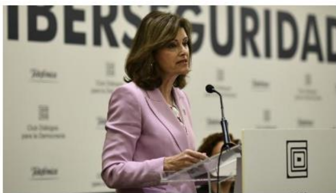
La secretaria de Estado de Seguridad, Ana Botella