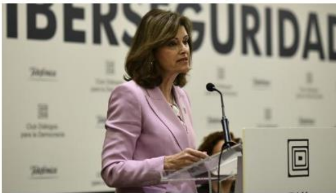
La secretaria de Estado de Seguridad, Ana Botella